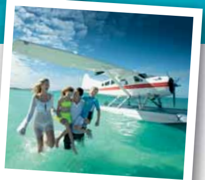
水上飞机的尊贵体验